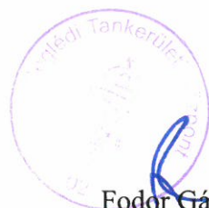
Fodor Gábor tankerületi igazgató